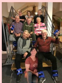
Die letzten Kursteilnehmer.

Wir freuen uns wieder auf zahlreiche Anmeldungen.